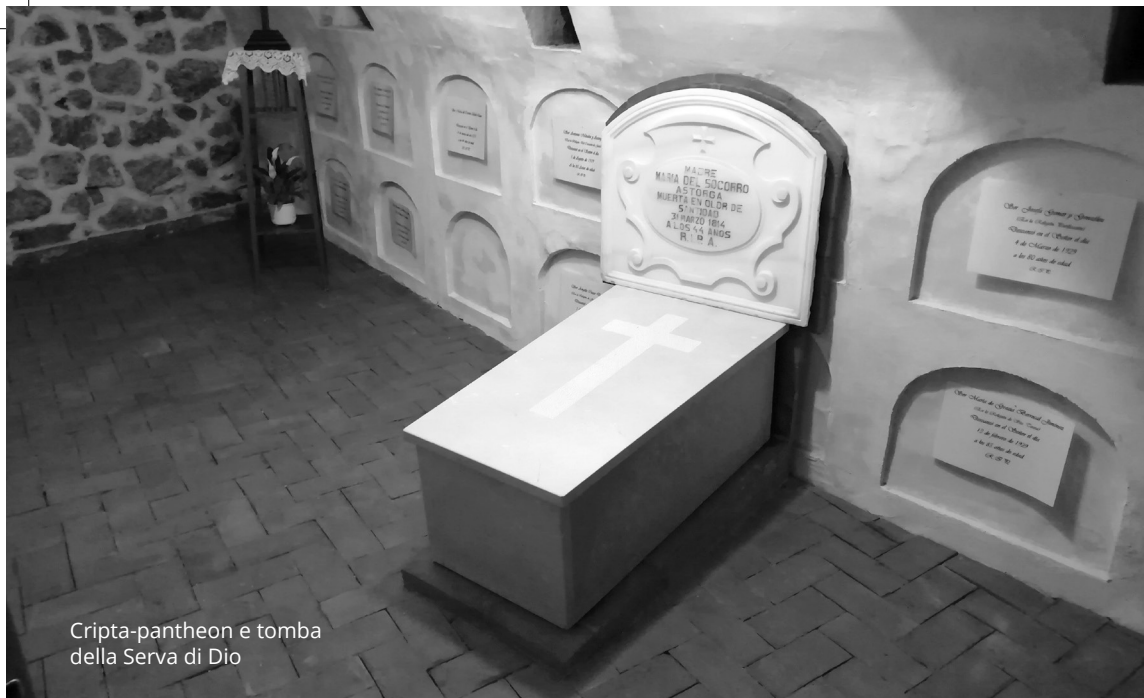
Cripta-pantheon e tomba della Serva di Dio

malattie e tutte le difficoltà che avrebbe incontrato nel cammino di santificazione, che Dio aveva preparato per lei.