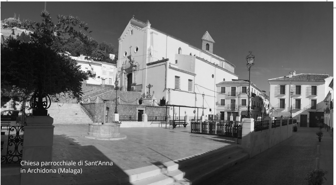
Chiesa parrocchiale di Sant'Anna in Archidona (Malaga)

mai motivo per perdere di vista i suoi fermi propositi di dedizione, servizio e generosità. Furono piuttosto un'occasione per crescere nella pazienza e per unirsi a Cristo Crocifisso, di cui voleva essere sposa.